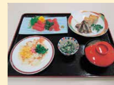
季節料理の一例です。

当施設では、プロの料理人によるおいしい料理をご用意いたします。ひとつひとつが丁寧に手作りされて、できたての料理を楽しんでいただけます。